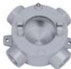
NECL325 com visor