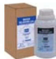
NEMS1/NEMS Massa Seladora